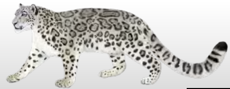
Panthère des neiges