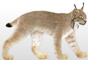
Lynx du Canada