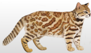
Chat des pampas